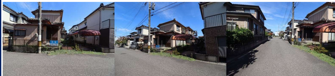
※現況と図面もしくは間取り図に相違がある場合は現況を優先します。